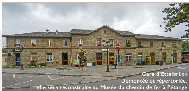
Gare d'Ettelbrück Démontée et répertoriée, elle sera reconstruite au Musée du chemin de fer à Pétange