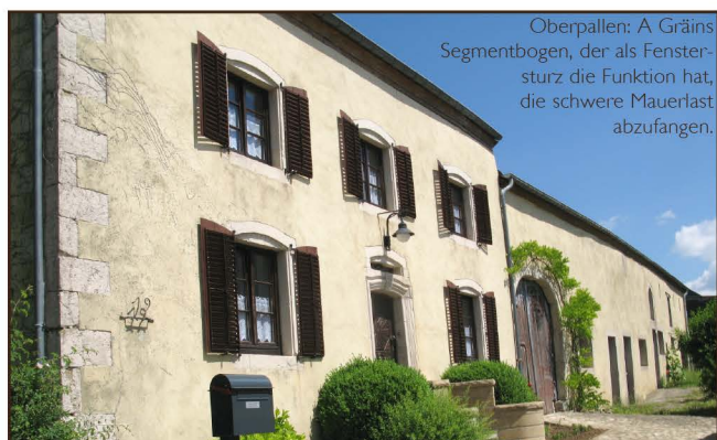
Oberpallen: A Gräins Segmentbogen, der als Fenstersturz die Funktion hat, die schwere Mauerlast abzufangen.

Iwwerdeems de Wiessel op de Barock an anere Regiounen vun Europa schonns am Ufank vum 17. Joerhonnert stattfonnt huet, huet et zu Lëtzebuerg bis zum 18. Joerhonnert gedauert, bis deen neie Stil sech etabléiert huet. Ee vun den Ausléiser vum Barock an Europa war d'Géigereformatioun (gewaltsam Réckféierung vun de Protestanten an déi kathoulesch Relioun). Am 17. an 18. Joerhonnert war d'kierchlech a weltlech Muecht absolut a vu Gott legitiméiert. Den neien architektonesche Stil soll dës Autoritéit weisen an honoréieren; de Betruechter soll vu Glanz an Härlechkeet iwwerwältigt ginn. Dëst ass besonnesch evident an de barocke Kierchen mat hiren prachtvollen Miwwel.